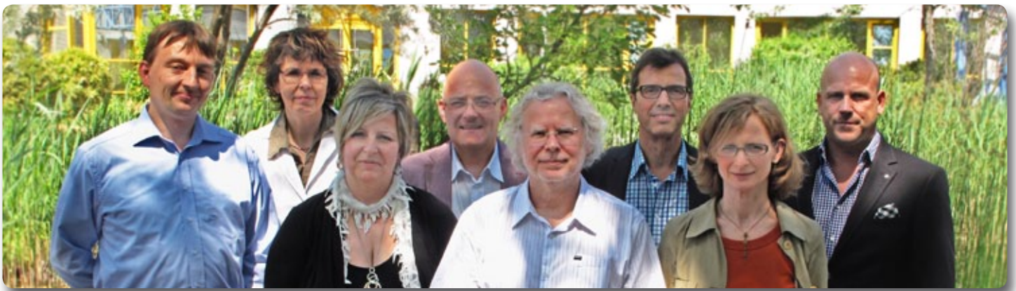
Die Mitglieder der Jury für „konzept m+b“ 2012 (v.l.n.r.):